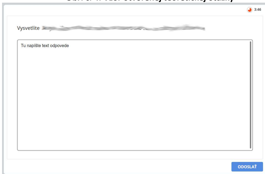
Obr. č. 4. Vzor otvorenej teoretickej otázky

Po odoslaní poslednej odpovede, resp. po uplynutí času sa test ukončí a uvidíte vyhodnotenie testových otázok (A-B-C-D) a účtovania na účtoch. K uvedeným bodom sa ešte manuálne pripočíta hodnotenie za vypracované teoretické otázky. Hodnotenie bude udelené v AIS do 5 pracovných dní od termínu konania skúšky.