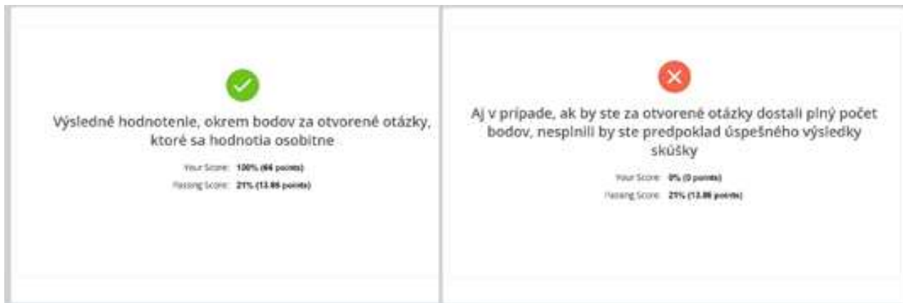
Obr. č. 5. Ukončenie testu

Po odoslaní poslednej odpovede, resp. po uplynutí času sa test ukončí a uvidíte vyhodnotenie testových otázok (A-B-C-D) a účtovania na účtoch. K uvedeným bodom sa ešte manuálne pripočíta hodnotenie za vypracované teoretické otázky. Hodnotenie bude udelené v AIS do 5 pracovných dní od termínu konania skúšky.